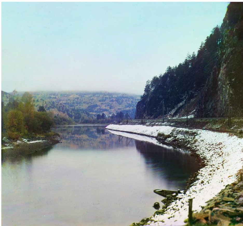
Закругление железнодорожного пути у станции Вязовой. 1909